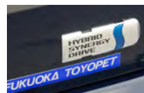
▲LPGガスと電気で駆動

タクシー最新モデル JPN(ジャパントクシー) 明治の異国人に『ジャパン・ブルー』 と呼ばれた深い藍色を採用している。 東京オリンピックで町を塗り替えたいと言う ディーラーの夢を乗せた車両でもある。