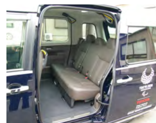
▲スライドドアで広い開口部