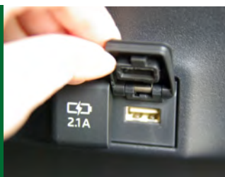
▲後部席にUSB充電端子