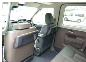
▲高い天井とフラットな足元