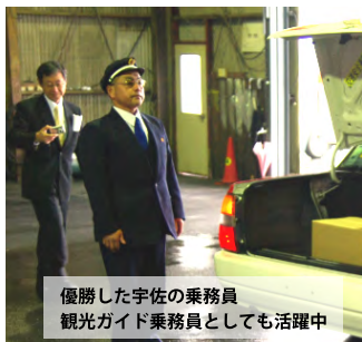
優勝した宇佐の乗務員 観光ガイド乗務員としても活躍中

小倉から豊後高田の9つのエリアで接客マニュアルの完成度を競う競技会が開催されました。初めての雨天により予定変更もあり、毎年連勝していた行橋営業所を破って宇佐営業所が優勝しました。(2019.03.03)