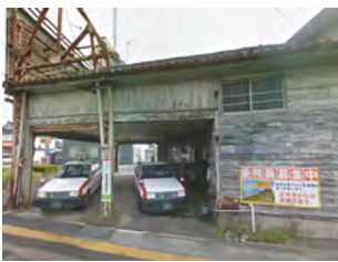
▲大分県宇佐市大字法鏡寺のタクシー待機所（左：新／右：旧）