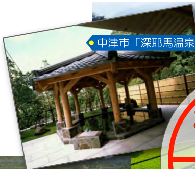
中津市「深耶馬温泉」