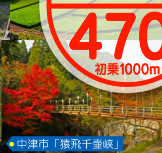
中津市「猿飛千壺峡」