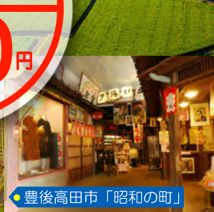
豊後高田市「昭和の町」