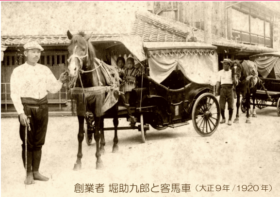
創業者 堀助九郎と客馬車 (大正9年/1920年)