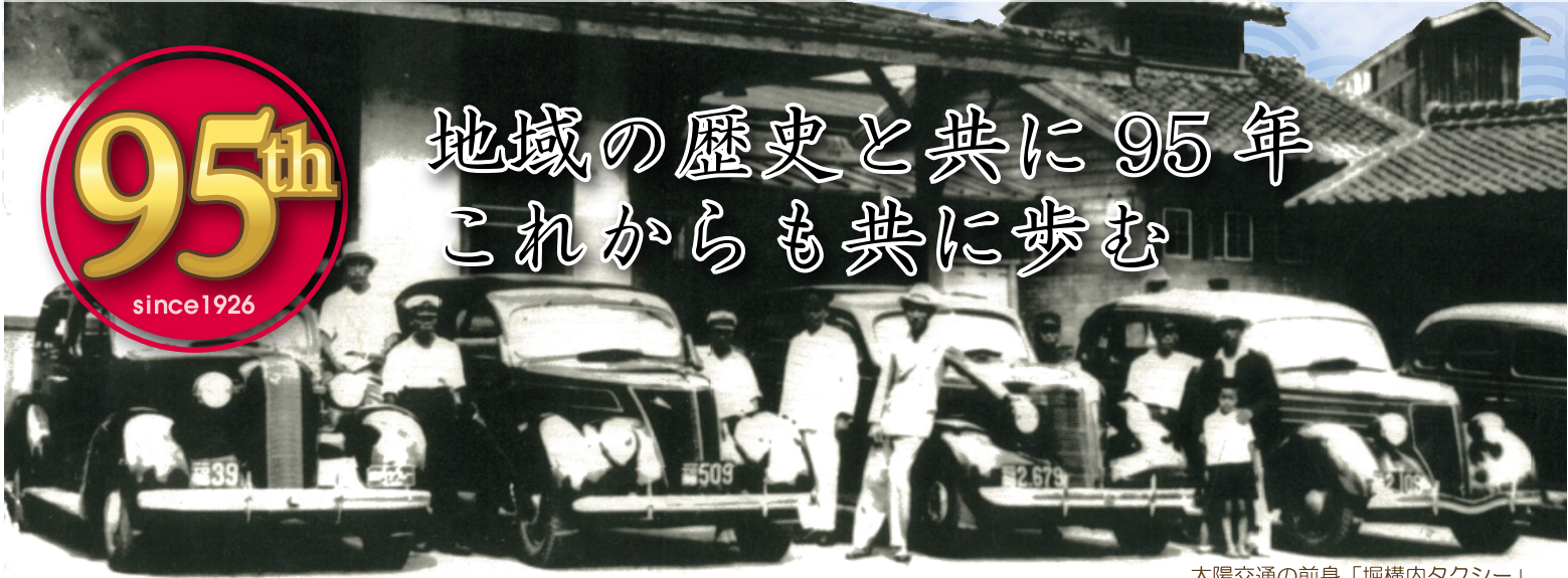
太陽交通の前身「堀構内タクシー」