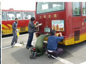
▲貸切バスを磨くバス運転手