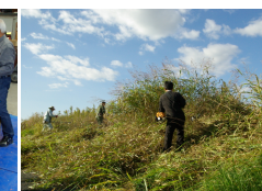
▲管理職による草刈り