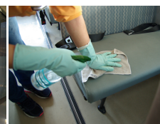
▲添乗員がバスを消毒