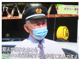
犯人が降りたあとどういった行動をするのを見てたんです