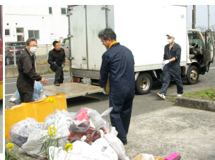
▲管理職による倉庫の大掃除